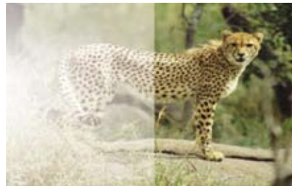
Eine normale Leinwand bei Tageslicht (links)... und die Planar Xscreen Leinwand bei Tageslicht (rechts.)

Eine perfekte Funktionsweise ist von größter Bedeutung für jeden, der ein großartiges Heimkinoerlebnis genießen will. Doch das gleiche gilt auch für das Design. Hier hat Planar hat die Messlatte höher gelegt und zeigt, wie Großbildprojektion aussehen sollte. Stellen Sie sich die glänzenden Gehäuse der anderen hochwertigen Komponenten Ihres Heimkinos vor, wie sie umgeben sind von der reichhaltigen, brillanten Farbe und der Hochglanzoberfläche des Xscreens. Xscreen wurde entworfen, um Ihrem guten Geschmack entgegenzukommen, und um etwas darzustellen, wofür man Bewunderung erntet. Xscreen bringt Ihnen echte Freude, und Ihre Freunde und Nachbarn werden Sie darum beneiden.