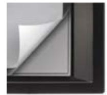
Xscreen verwendet die lizenzierte ALR-Filmtechnologie als Projektionsfläche, um wunderschöne, kontrastreiche Bilder mit jedem Projektor zu erzeugen.

Schließlich ist Xscreen eine Lösung, die wirklich jeden Raum in ein eindrucksvolles Kino verwandelt.