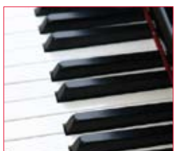
Hohes ANSI Kontrastverhältnis

ANSI Kontrast † ist eine Art der Bewertung, die den tatsächlich echten Kontrast misst, die man von einem Projektor zu Hause erwarten kann. Dieses technische Messverfahren beinhaltet eine reproduzierbare Methode, die verwendet werden kann, um die Leistung der Projektoren mit unterschiedlicher Display-Technologie vergleichen zu können.